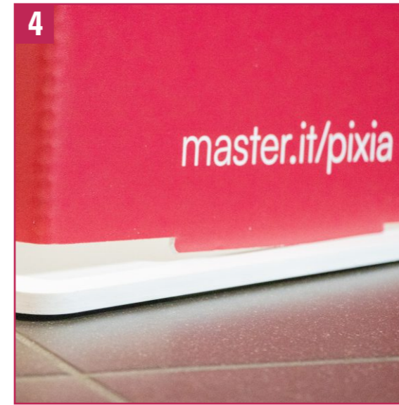
4. Fit the red piece onto the base. Make sure all 4 sides fit together properly.