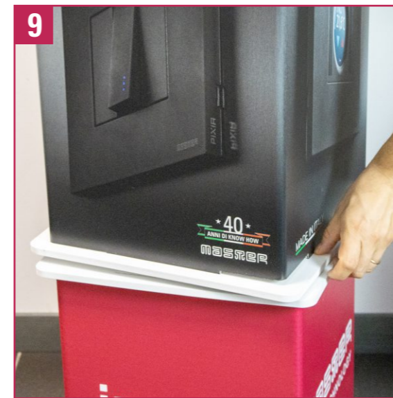
9. Check that the upper piece (with the plates) fits correctly on the rotating base. Test the rotation of the base. If you have difficulty, press the corners lightly before inserting them into the slots.