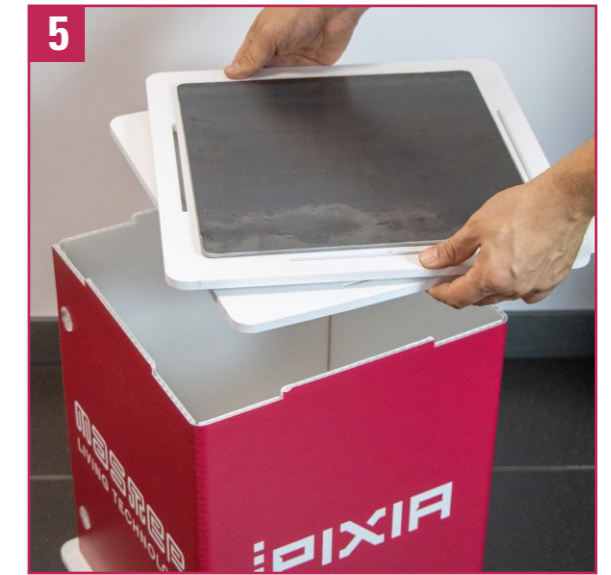
5. Take the rotating base with the metal plate from the packaging.