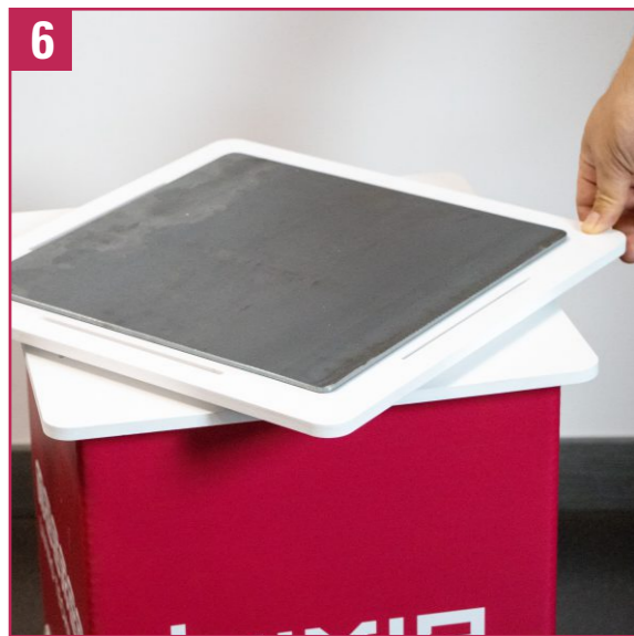
6. Place the rotating base on the red body (metal plate facing upwards) and fit the four sides together.