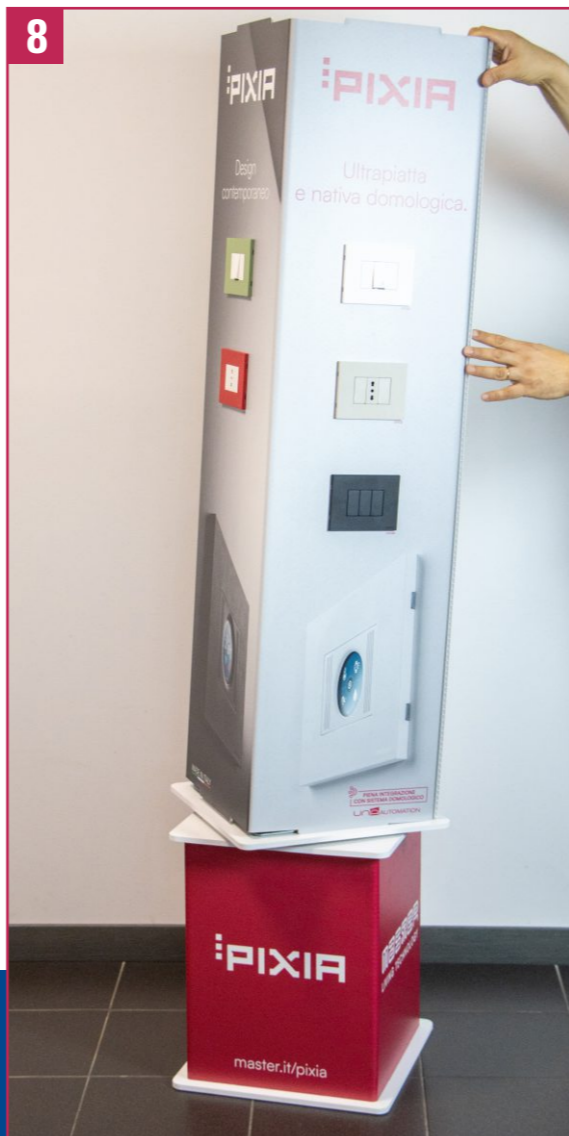
8. Take the upper piece (with the plates and devices) and fit it on the rotating base.