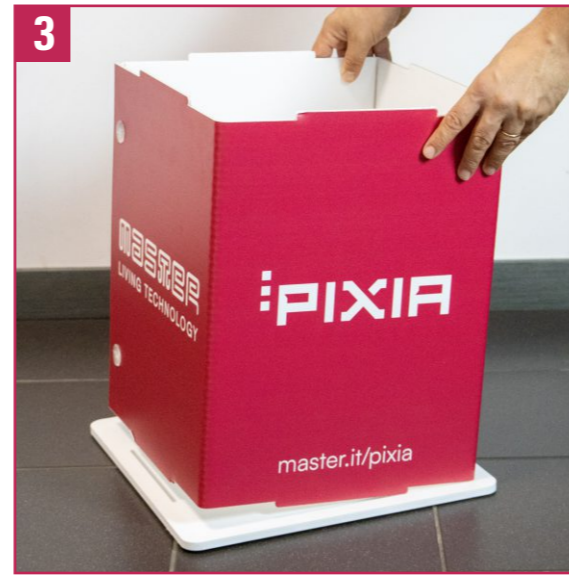
3. Take the red bottom piece.