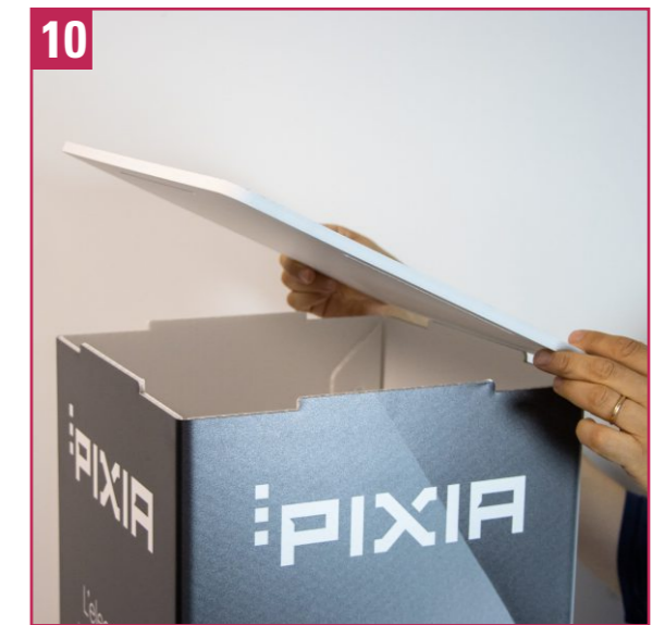
10. Place the top cap on the piece with the plates. Remove any protective film. Check that all components are perfectly installed and without gaps.