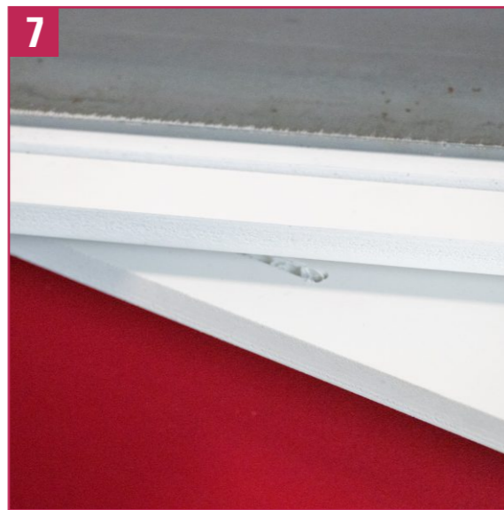
7. Check that the red piece fits correctly on the rotating base. Test the rotation of the base.