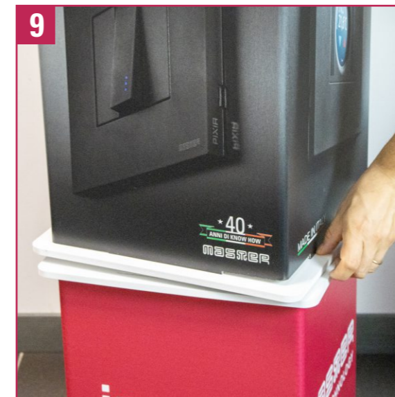
9. Verificar que el cuerpo con las placas esté correctamente encajado en la base giratoria. Probar la rotación de la base. En caso de dificultad, presionar ligeramente las esquinas antes de insertarlas en las ranuras.