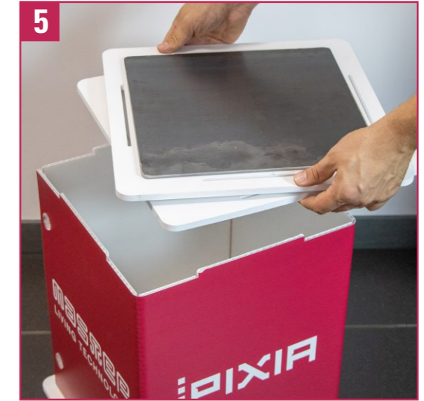
5. Sacar de la caja la base giratoria con la placa metálica.