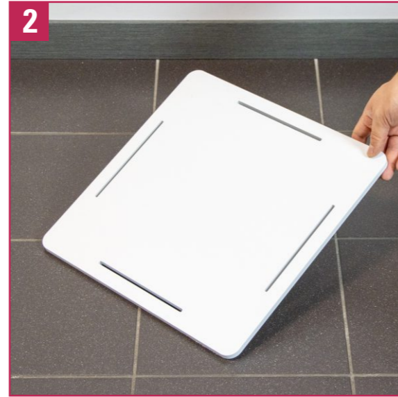
2. Colocar la base en el suelo con los tapones hacia abajo. Quitar la posible película protectora.