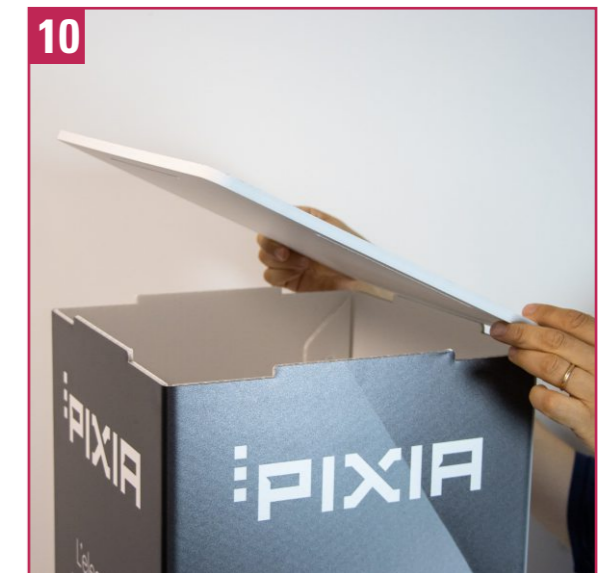
10. Colocar el tapón superior sobre el cuerpo con las placas. Quitar la posible película protectora. Verificar que todos los componentes estén perfectamente instalados y sin ranuras.