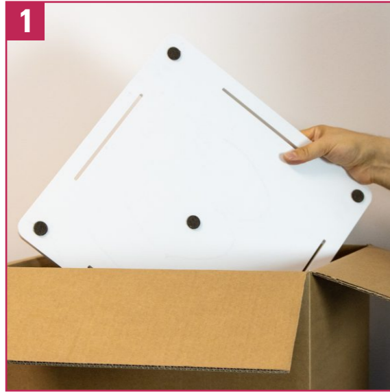
1. Sacar de la caja la base con los tapones de goma.

50IM.MANUESPO111 Foglio istruzioni montaggio Espo PIXIA rev. 11/06/2025