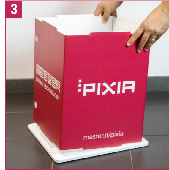
3. Sacar el cuerpo inferior rojo.